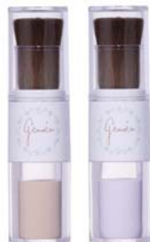
【カラー】 ナチュラルライト パープル